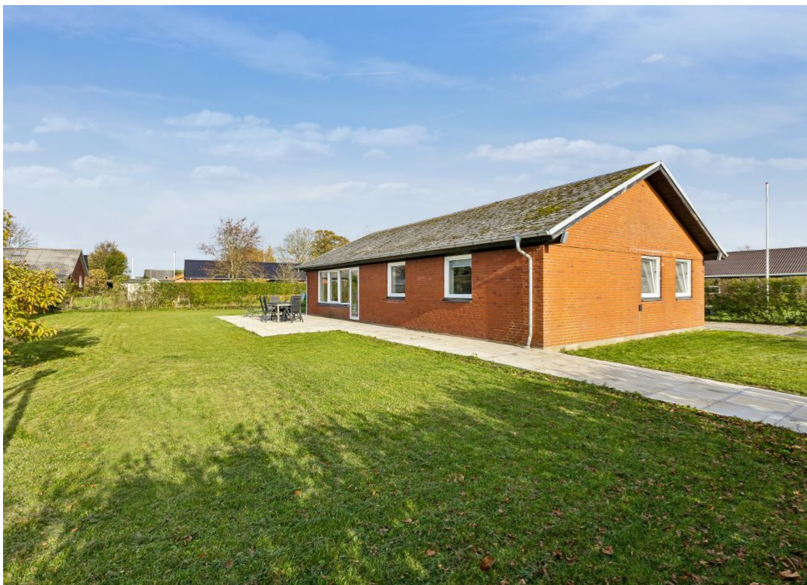
Uglevænget 6 6760 Ribe